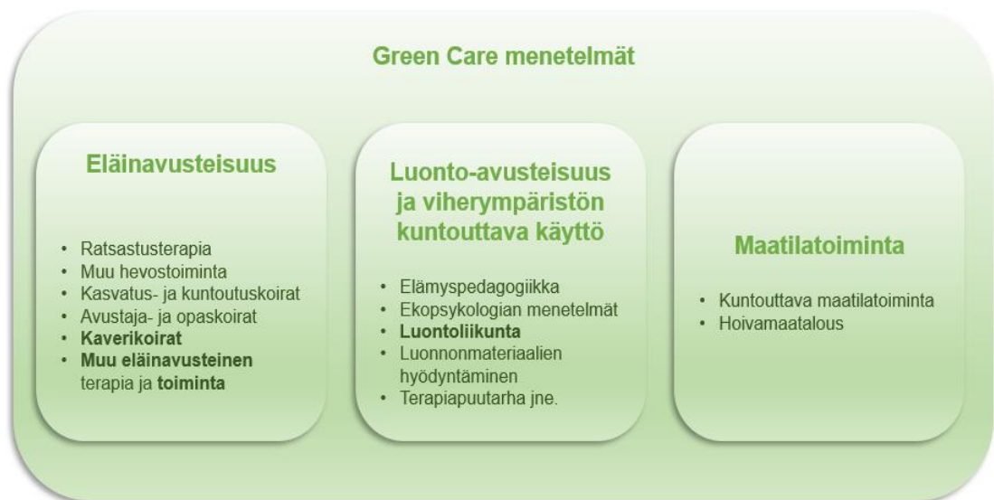
Kuvio 2. Green Care -konsepti. (mukaillen Kahilaniemi 2016, 17).

Alla oleva kaavio kertoo mitä Green Care -toiminnan alle voidaan sijoittaa.